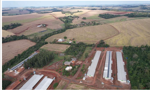
ESTRADA RURAL LINHA SANGA ITUPORANGA