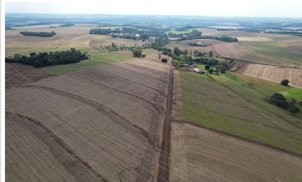
ESTRADA RURAL LINHA SANGA ITUPORANGA