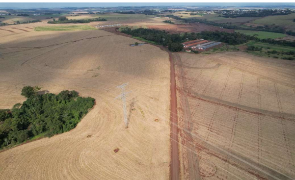
ESTRADA RURAL LINHA SANGA ITUPORANGA