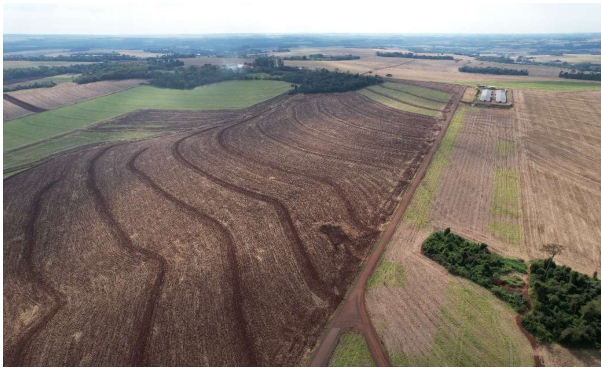
ESTRADA RURAL LINHA SANGA ITUPORANGA

Projeto: ESTRADA RURAL - LINHA SANGA ITUPORANGA