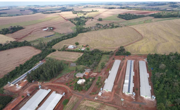
ESTRADA RURAL LINHA SANGA ITUPORANGA