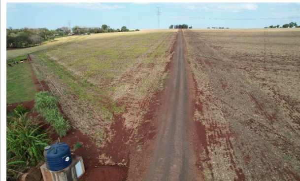
ESTRADA RURAL LINHA SANGA ITUPORANGA